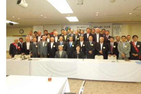
全員で記念写真を!